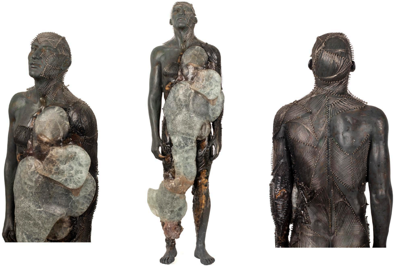
Fiberglass, Steel wire & Glass | 25 × 88 × 17 cm