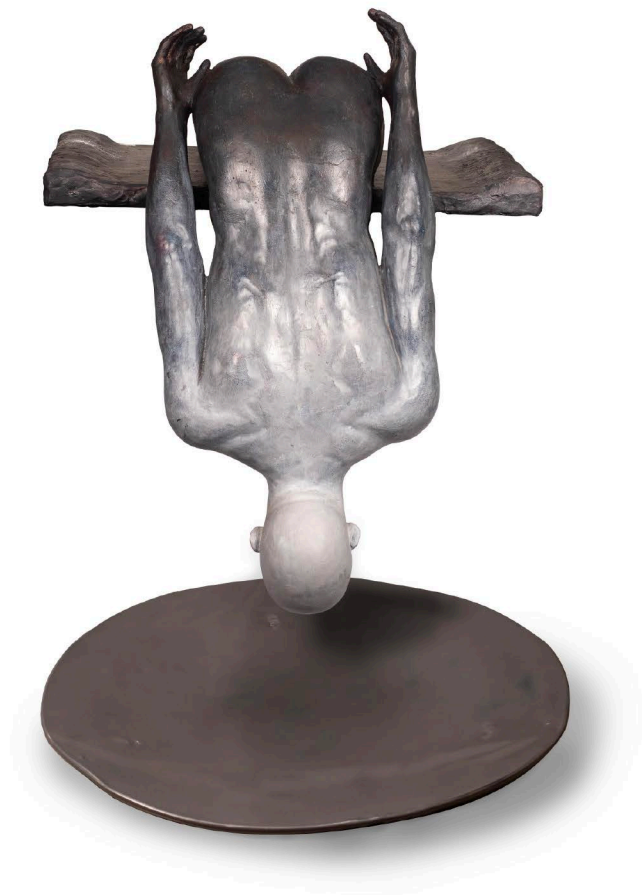
Fiberglass & Iron | 66x54x45 cm