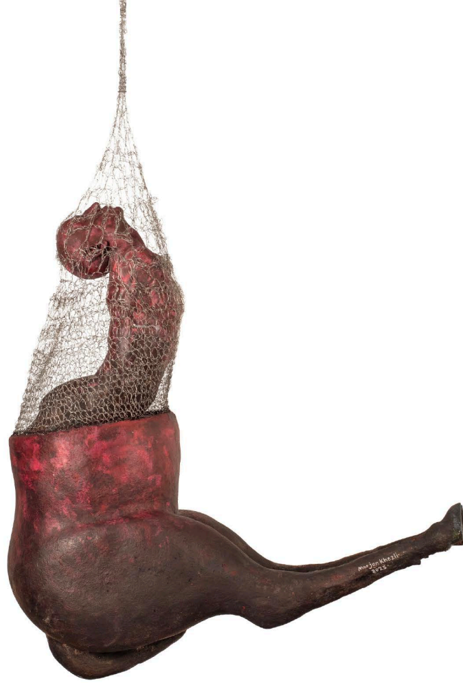
Fiberglass, Paper mache & Steel wire | 105 x 105 x 35 cm