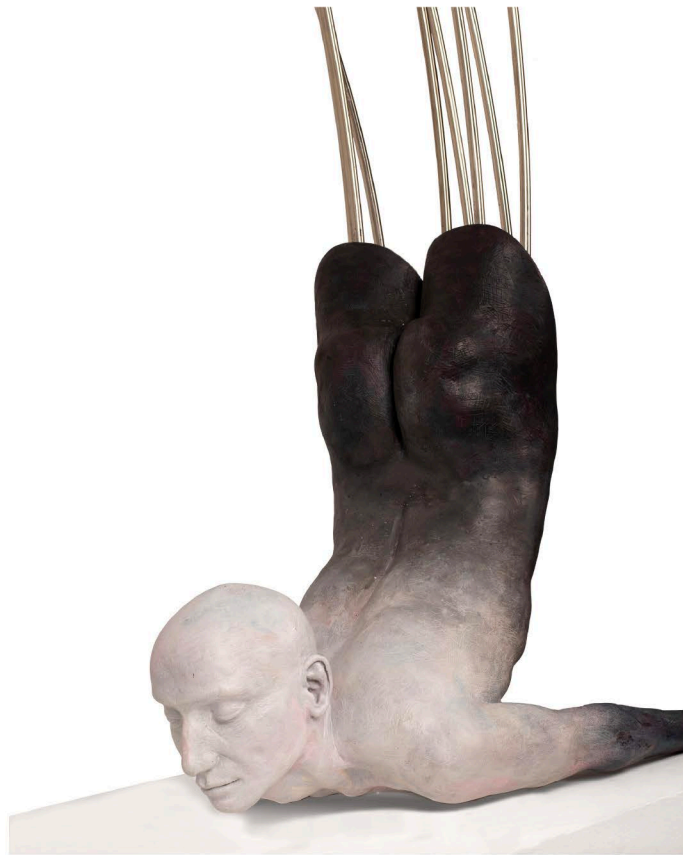
Fiberglass, Steel wire & Stainless steel tube | 115 x 165 x 34 cm