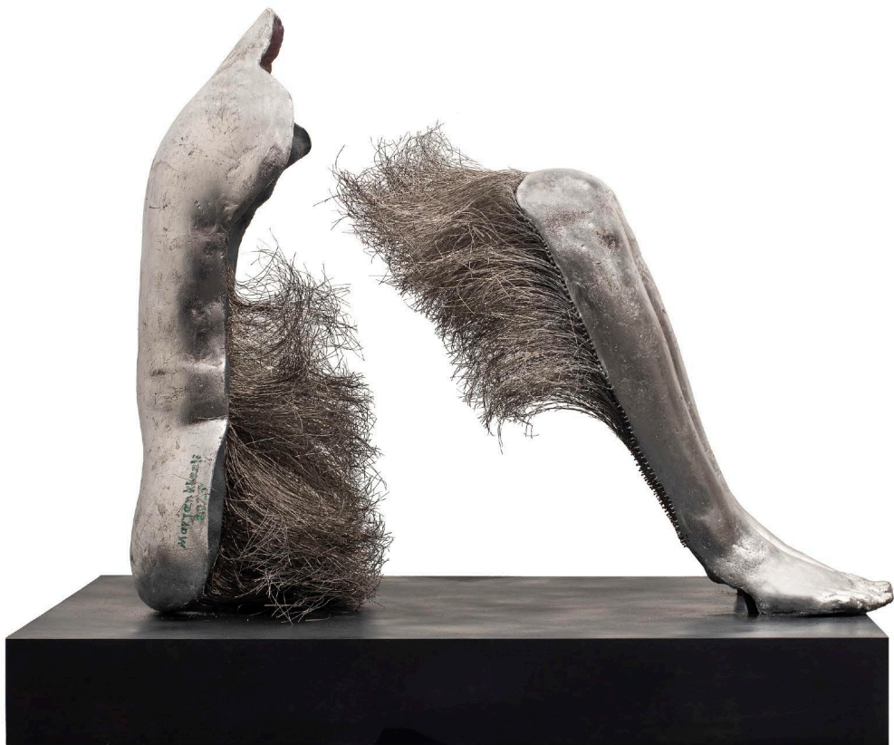
Fiberglass, Resin & Steel wire | 82 x 72 x 62 cm