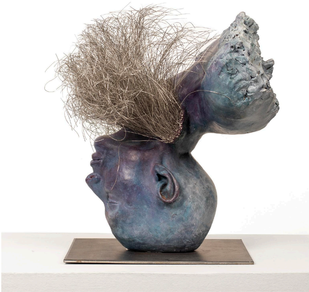
Fiberglass, Steel wire & Iron | 35 x 42 x 40 cm