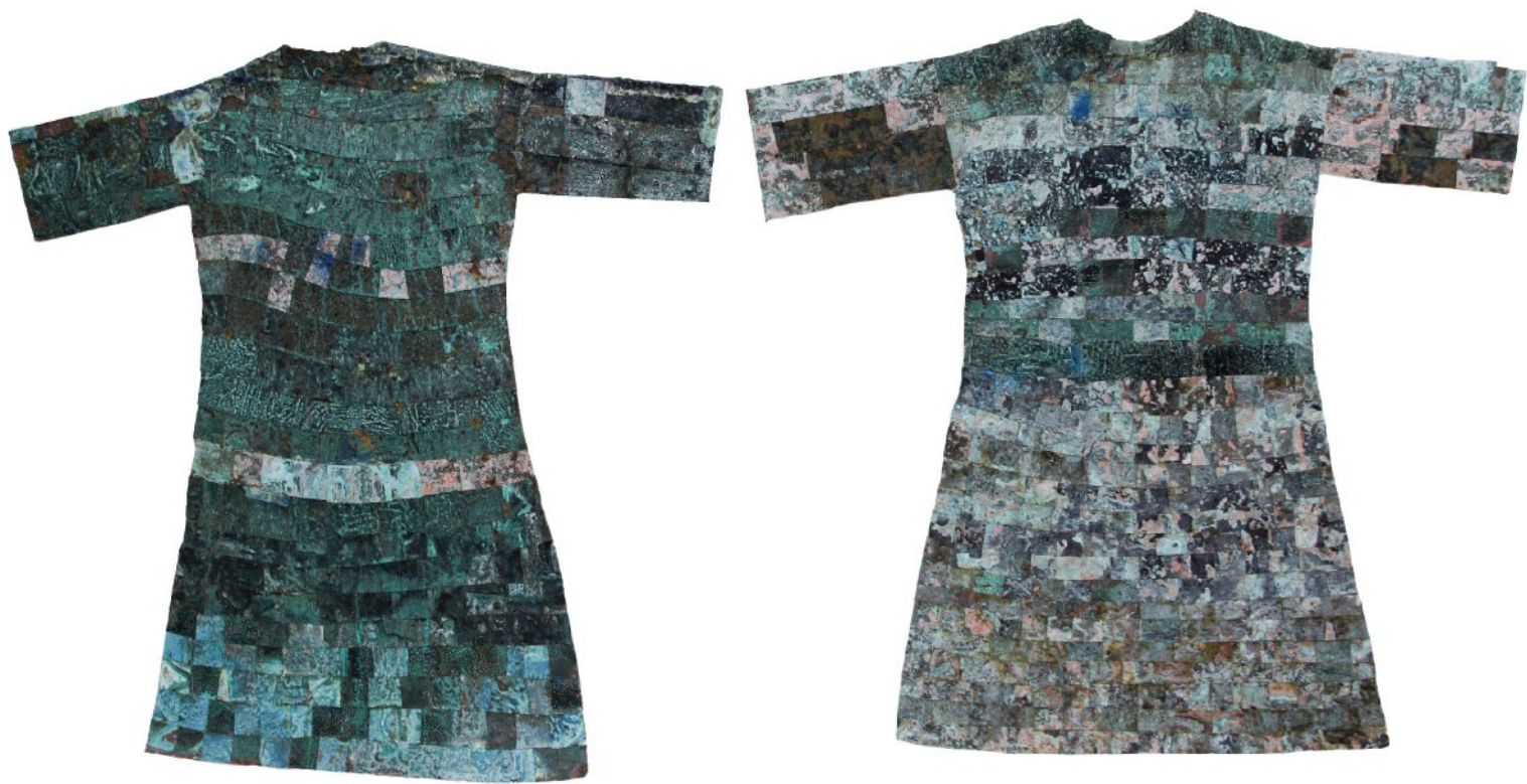
Oxidized pieces of copper and brass on fiber, fixed on wooden frame | Each piece 130 x 120 cm