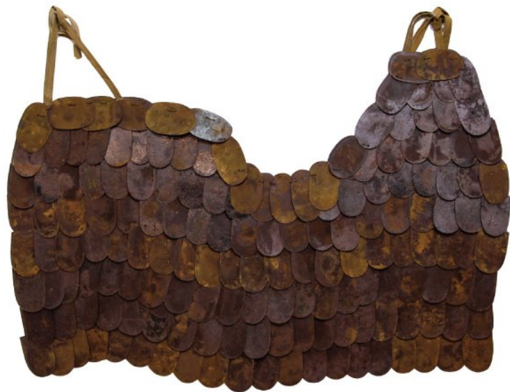
Oxidized pieces of iron, Fiber, Thread | Each piece 150 x 100 cm