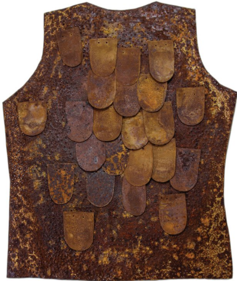
Oxidized pieces of iron | 55 x 66 cm