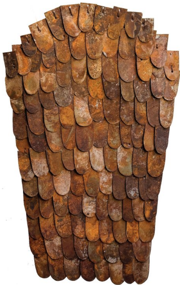
Oxidized pieces of iron, Fiber, Thread | 30 × 50 cm