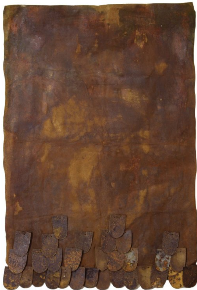
Oxidized pieces of iron on fiber, thread, oxidized copper leaf | 115 x 78 cm