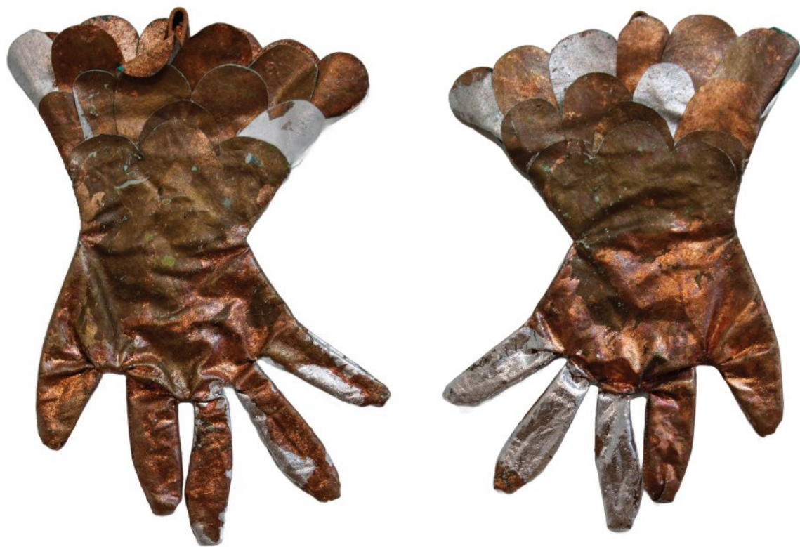
Oxidized copper leaf and silver leaf on fiber | 40 x 28 cm