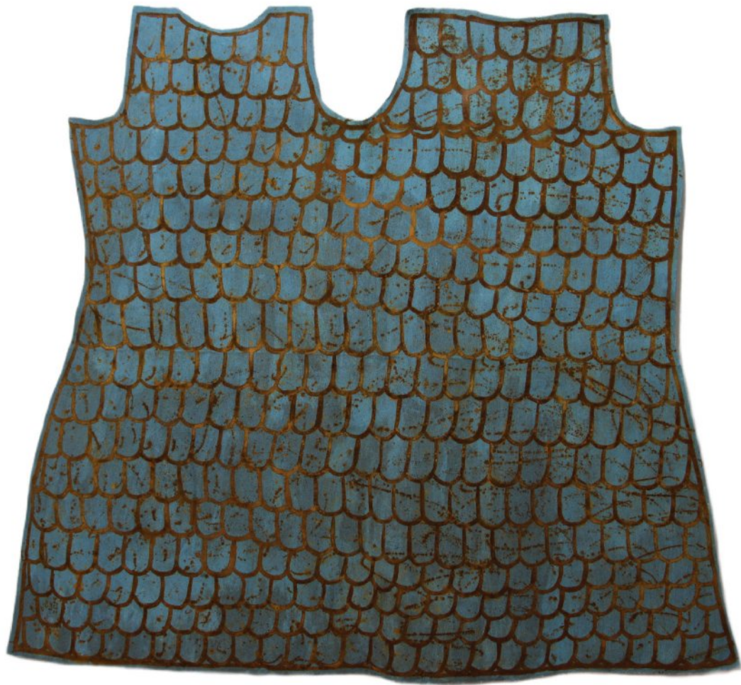
Painting with acid on fiber | 145 x 170 cm