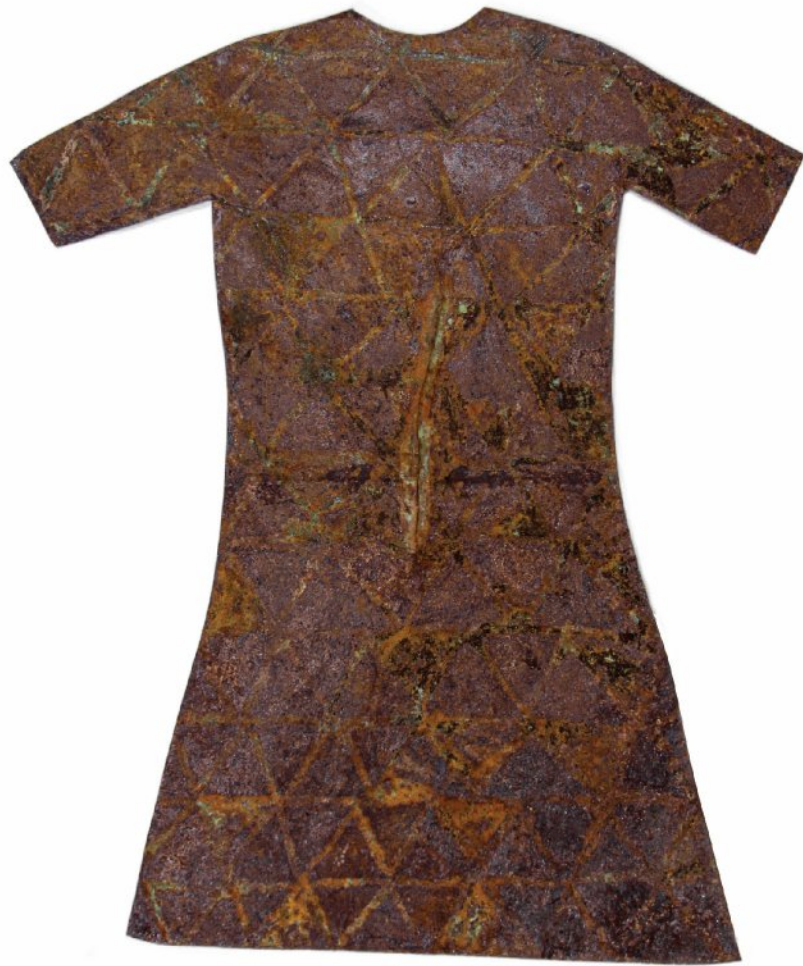
Oxidized oxidized sheet of iron | 98 x 116 cm