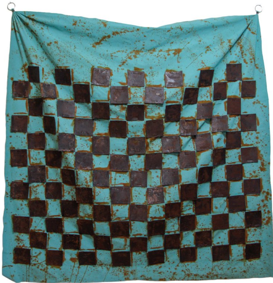
Oxidized pieces of iron,thread,acid on fiber | 200 x 200 cm