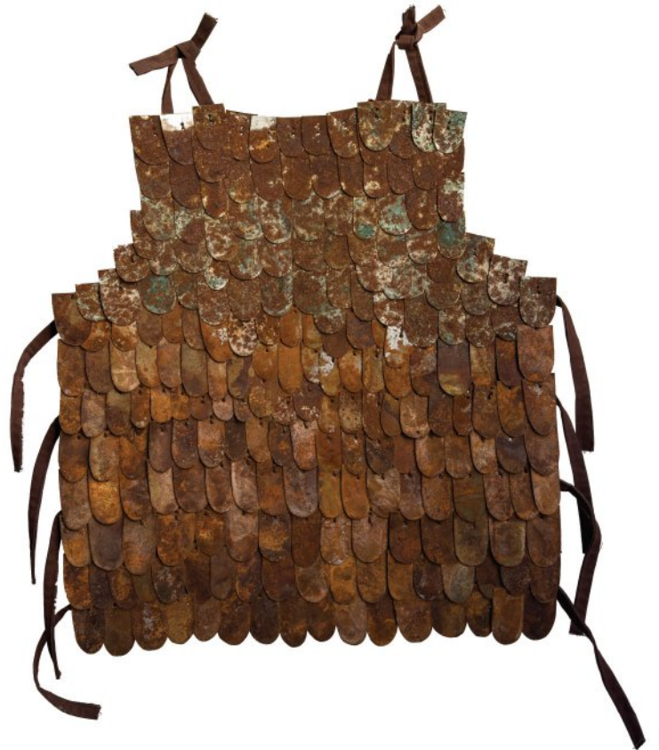
Oxidized pieces of iron, Copper, Brass, Fiber, Thread | Each piece 70 x 60 cm