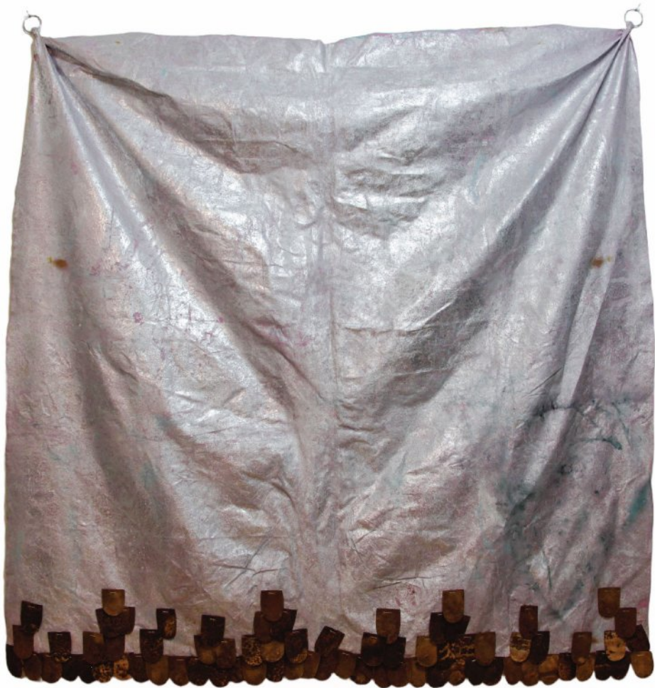
Oxidized pieces of iron on fiber, thread, silver leaf | 200 x 200 cm