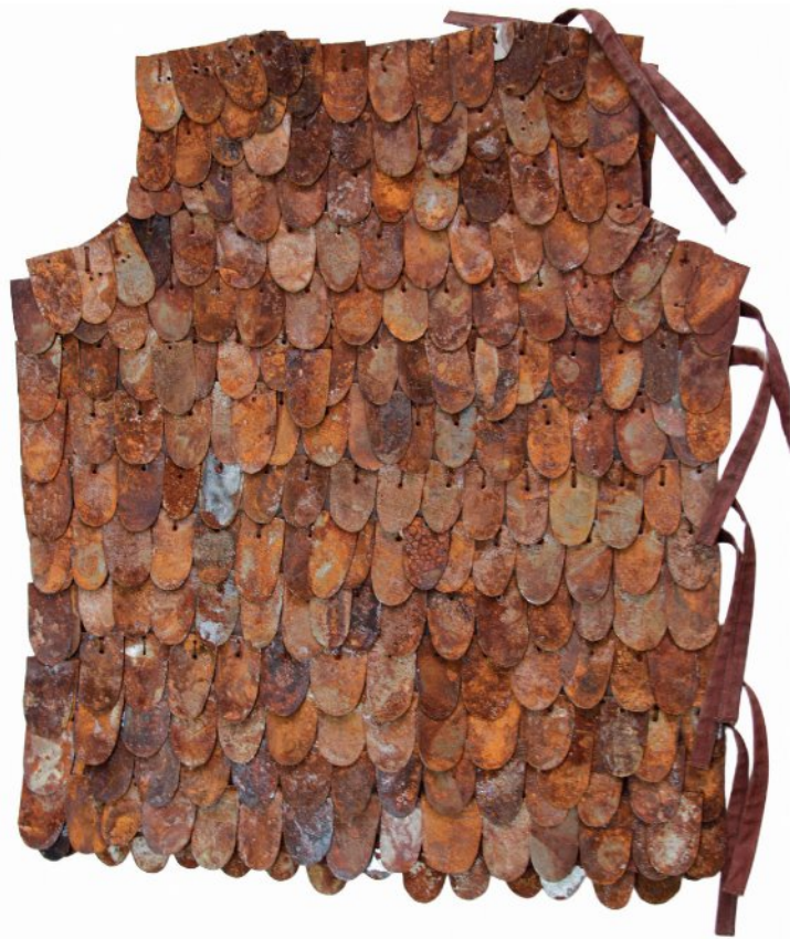
Oxidized pieces of iron, Copper, Brass, Fiber, Thread | 70 x 60 cm