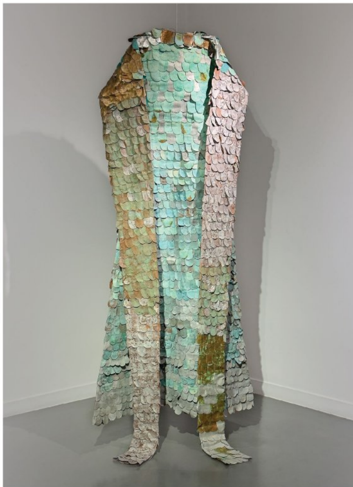
Oxidized copper leaf and silver leaf on pieces of fiber, fixed on fiber | 230 x 113 cm