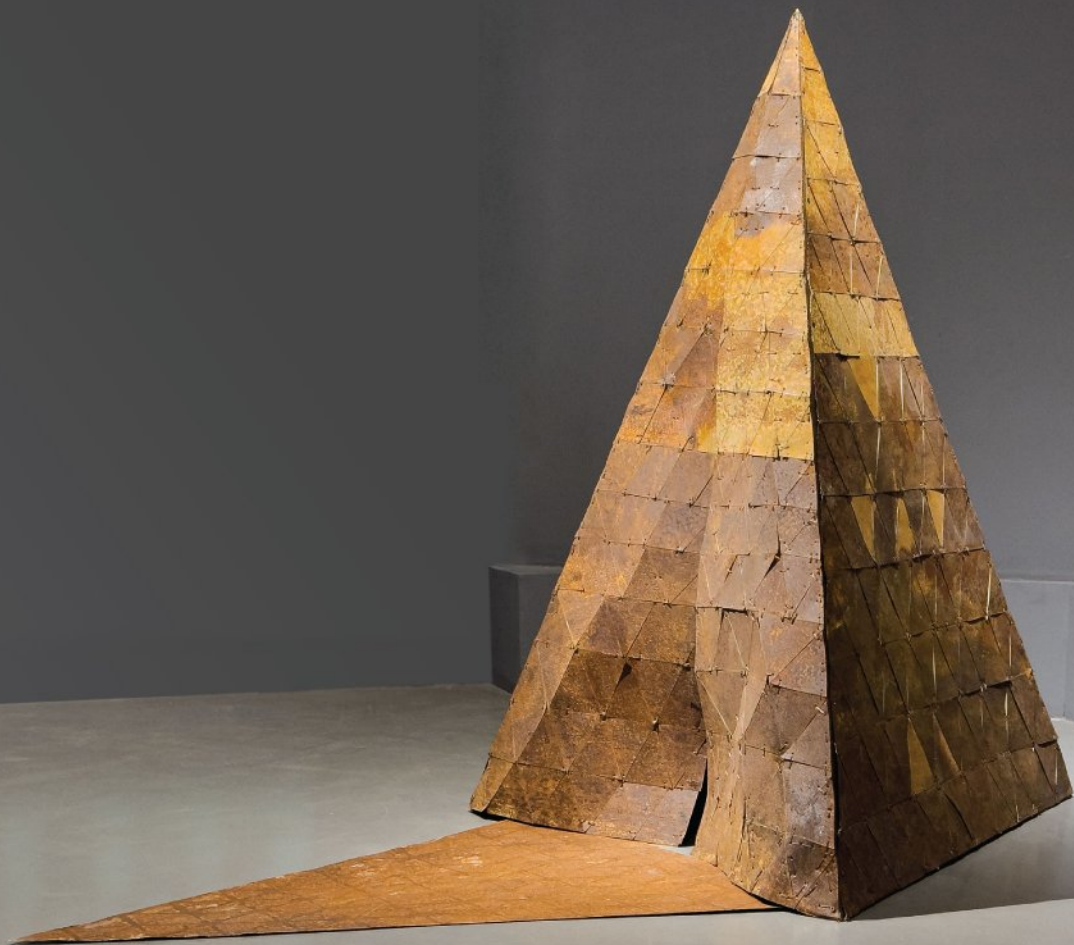
Pieces of oxidized iron, fiber, thread, fixed on wooden frame | 210 × 155 × 120 cm