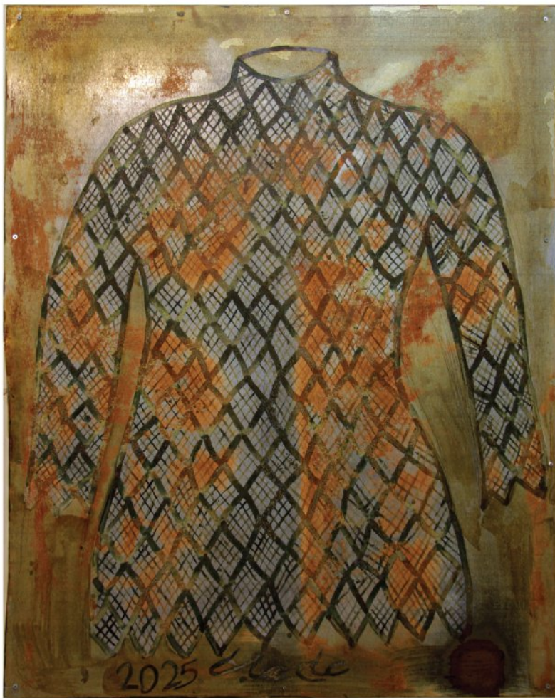
Painting with acid on iron sheet | 102 × 128 cm