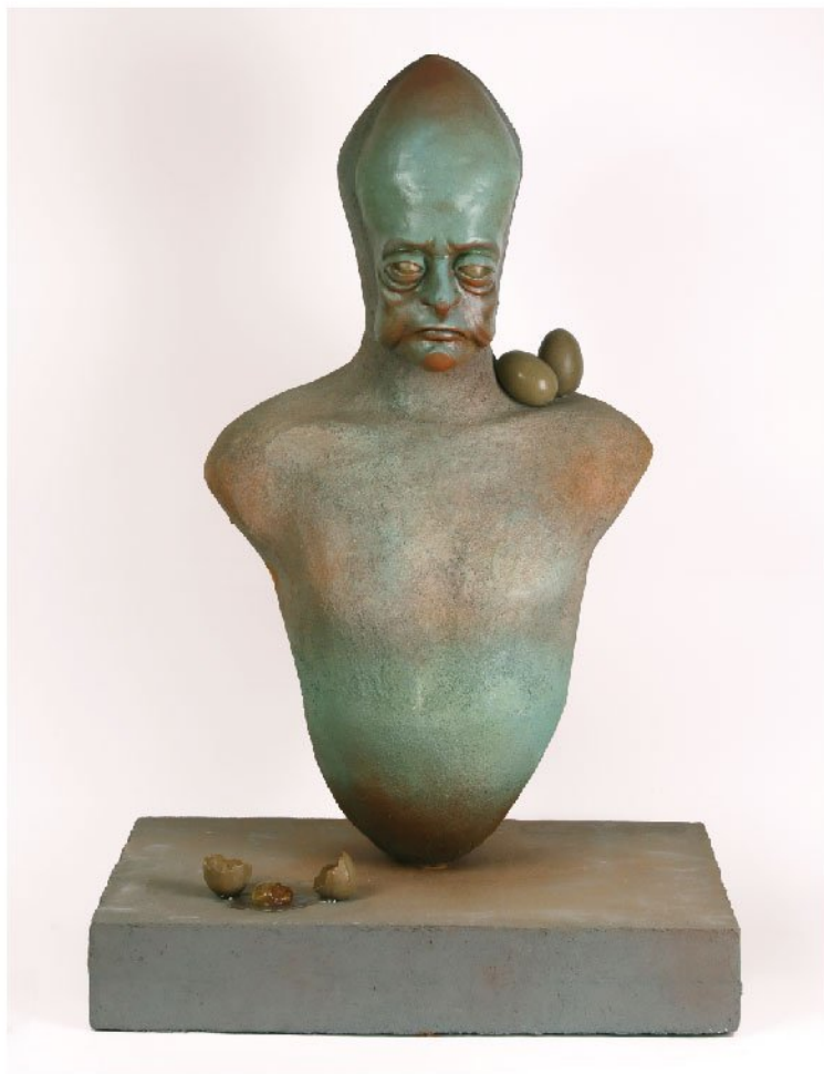
شونه تخم مرغ | Resin & Concrete | 90 × 60 × 40 cm