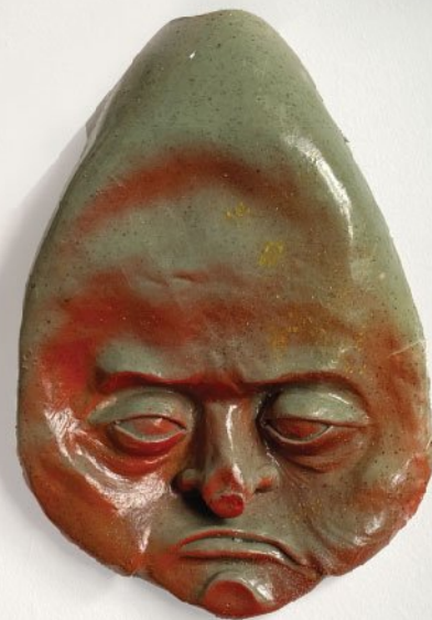
Fiberglass | 29 × 19 cm