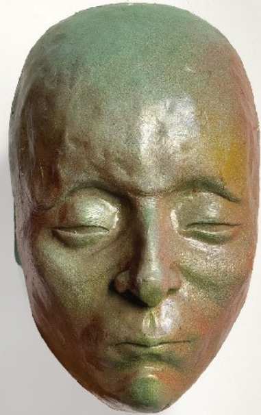
Fiberglass | 24 x 16 cm