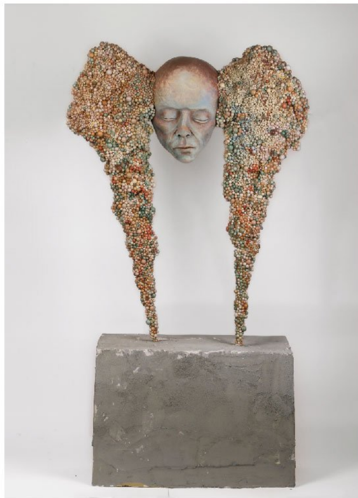
Fiber glass . Resin & Concrete | 121 x 70 x 25 cm