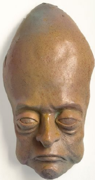
Fiberglass | 32 × 17 cm