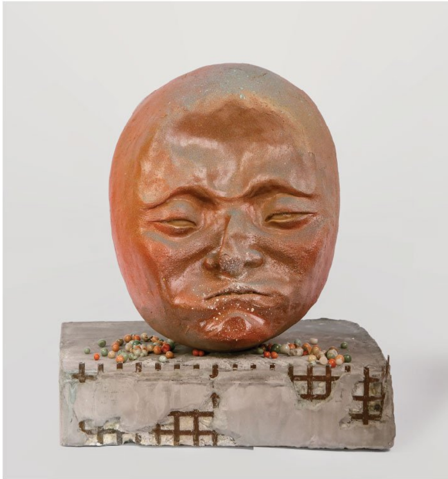
Mixed media | 25 × 25 × 30 cm