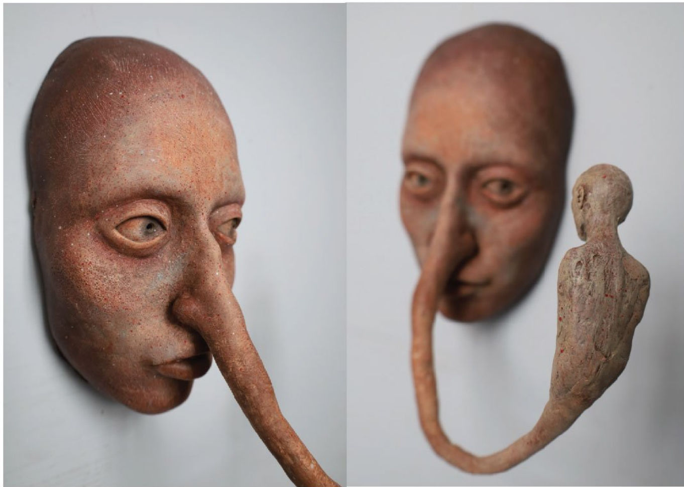
Fiberglass | 23 x 17 x 19 cm