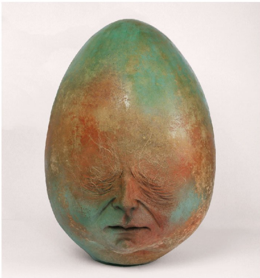
وقتی که خواب بودیم | Papiermache | 64 x 40 x 40 cm