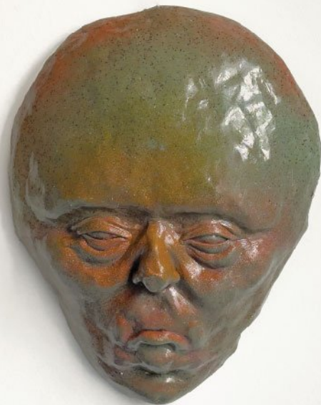
Fiberglass | 34 x 25 cm