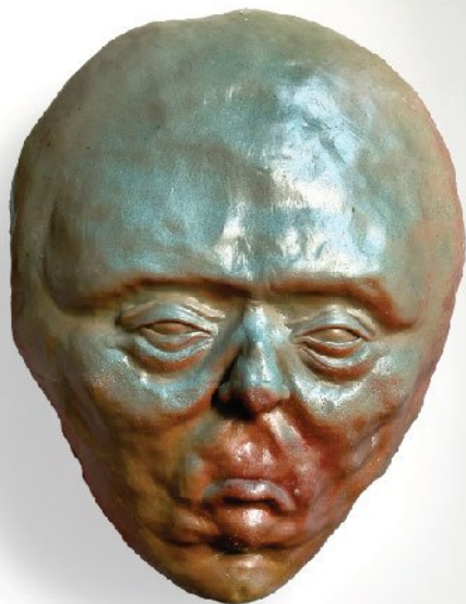
Fiberglass | 30 x 25 cm