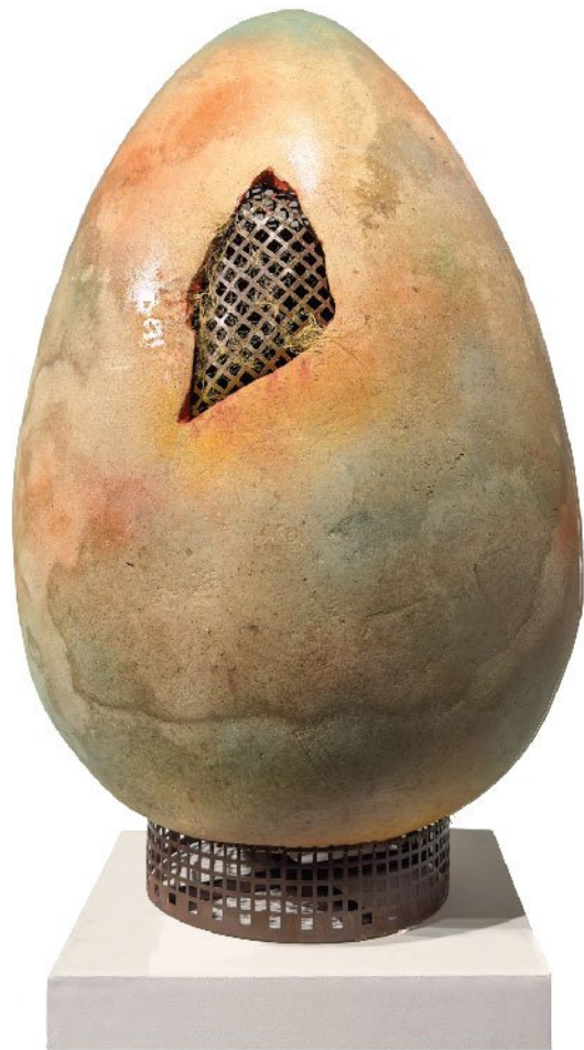
Papier mache & Metal | 90 x 50 x 50 cm