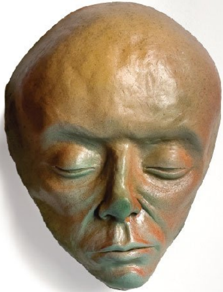
Fiberglass | 20 x 27 cm