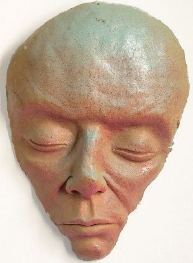
Fiberglass | 27x19 cm