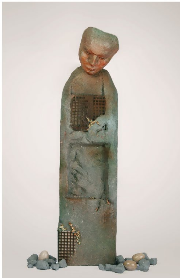
حسب حال | Papier mache, Concrete & Polyester | 23 x 23 x 110 cm