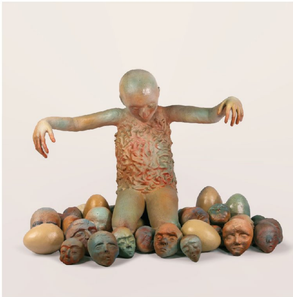
روای دسته جمعی | Mixed media | 70×50×45 cm