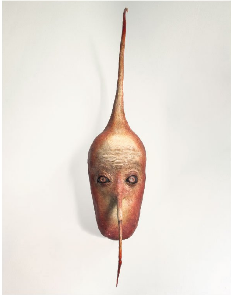
Papiermache | 70 x 36 x 18 cm