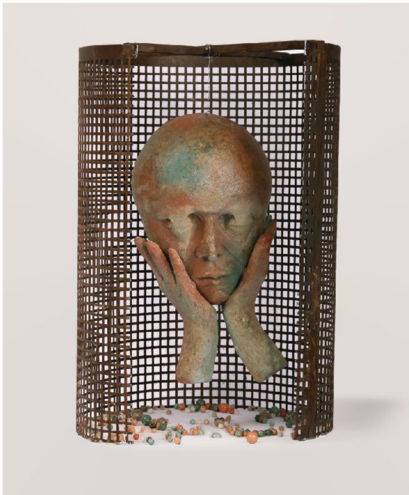
Resin, Papier mache & Metal | 60 x 40 x 40 cm