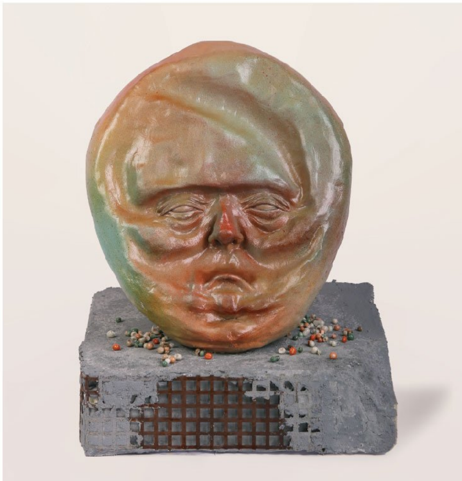
Mixed media | 42 × 32 × 32 cm