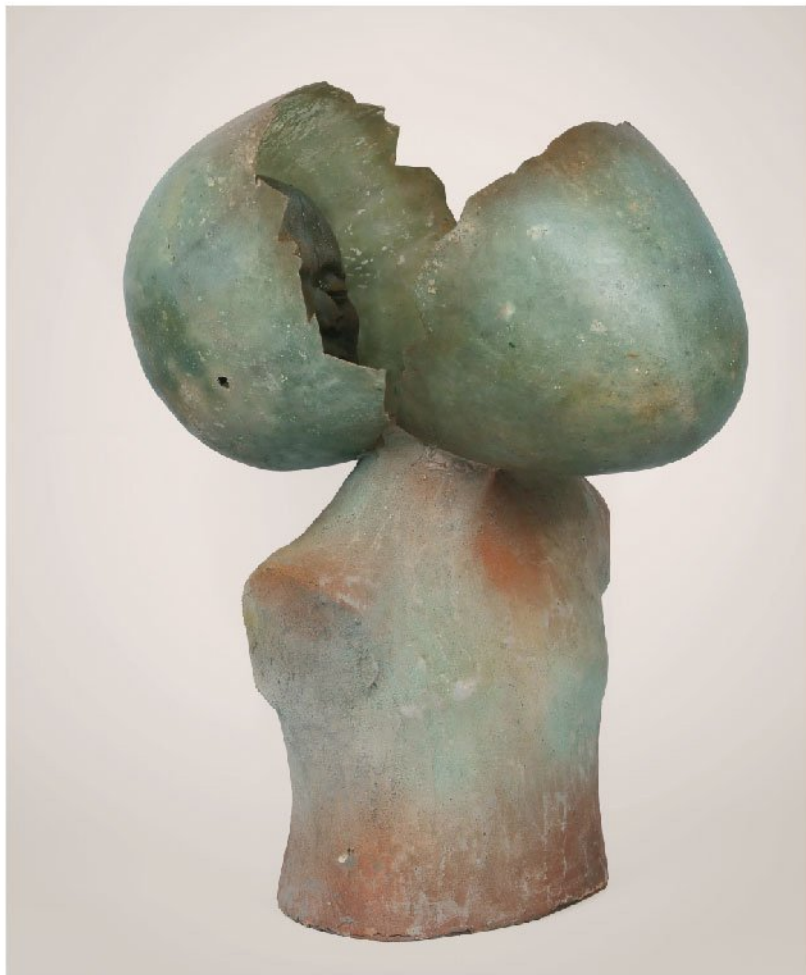
دو زرده | Fiber glass , Resin & Papier mache | 70 × 55 × 40 cm