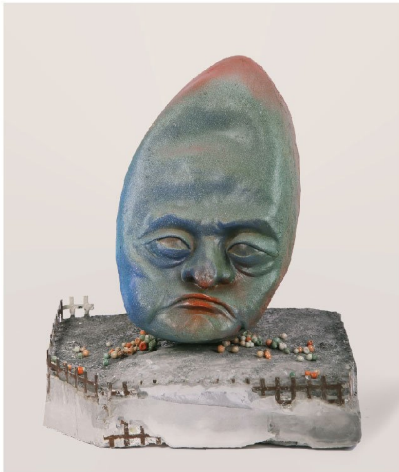
Mixed media | 37×27×26 cm