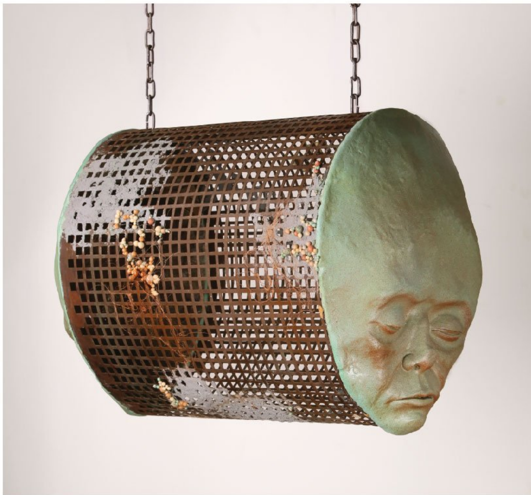
رخنه | Fiberglass & Metal | 55×40×35 cm