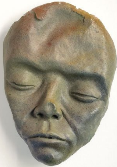
Fiberglass | 26x18 cm