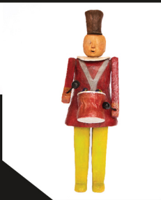
I want to be destroyed Ceramic & Papier mache 87x35x26