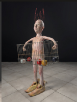
Mixed media 28.80.57