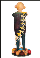
Can you see me? Ceramic 73.42x27