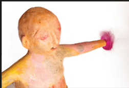
Look at me, I can fly Ceramic 58x54x40