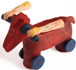
It seems that I had a horse Ceramic 32x30x45